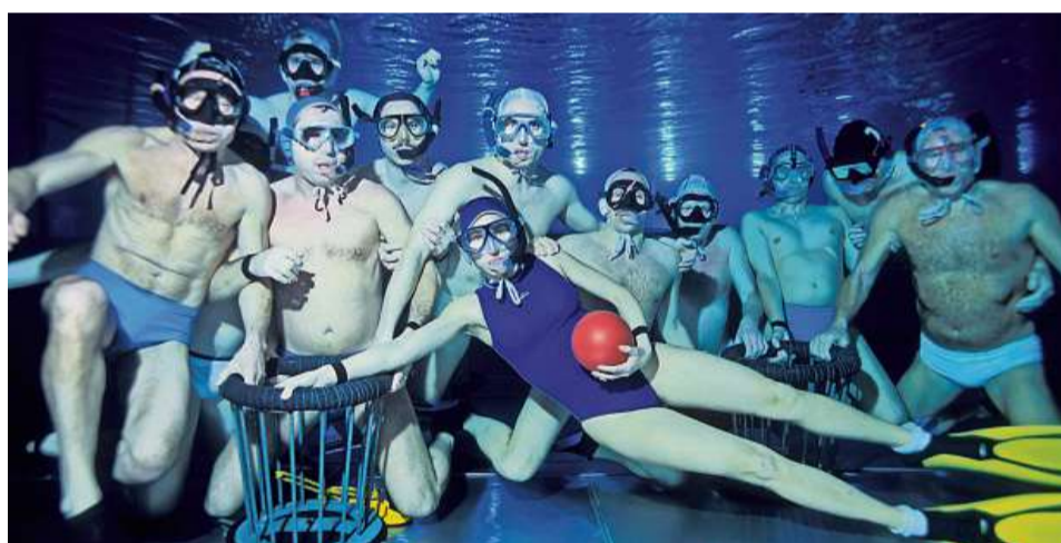
Die Teams unterscheiden sich durch verschiedenfarbige Badehosen und -anzüge.

hier so einige Tüftler“, gibt der Entwicklungsingenieur heiter zu.