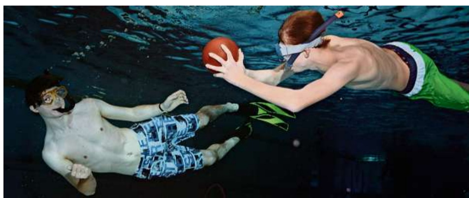
Unter der Oberfläche ist (fast) alles erlaubt, wenn man den Ball erobern möchte.